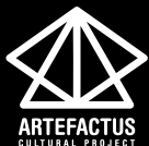
Foto del cartel

Todo comienza cuando una mujer irrumpe en el escenario y en medio de una vorágine de sentimientos cuenta su historia, poniendo énfasis en su empeño de ser actriz desde muy niña. Su objetivo es interpretar el monólogo La voz humana , de Jean Cocteau, pero comienza a confesar entre tragos, recuerdos, risas y llanto, anécdotas de su vida que componen un retrato de su soledad y de la entereza de una mujer que ha dedicado gran parte de su existencia al teatro.